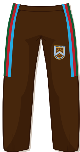
Pantalón deportivo marrón reglamentario