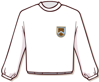
Buzo blanco con escudo