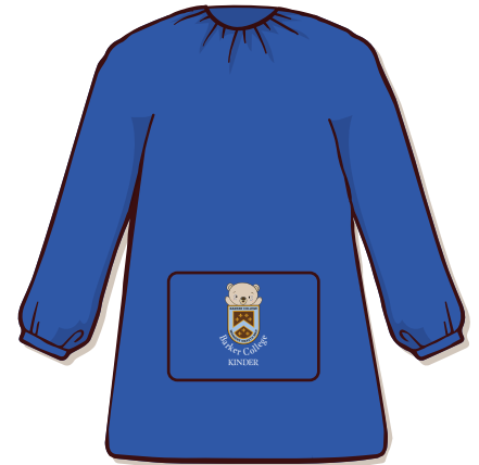
Camisolín azul (preferentemente) o rojo, con escudo