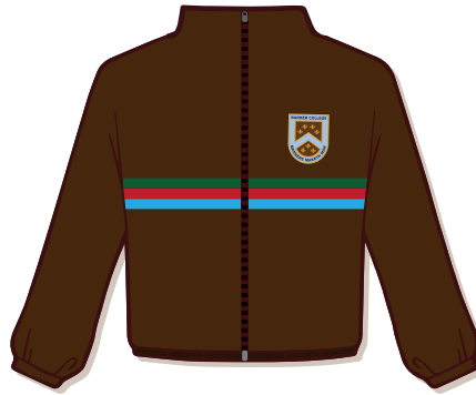
Campera marrón reglamentaria